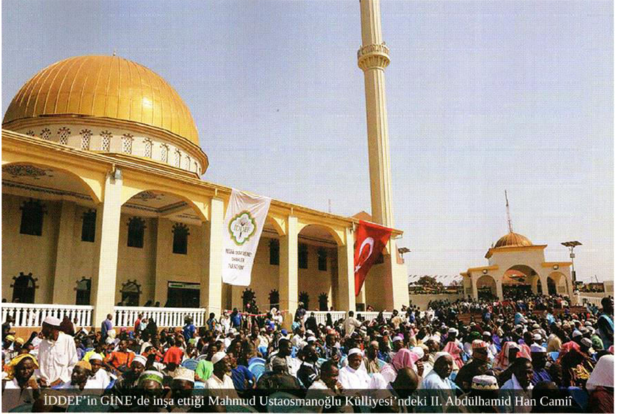
IDDEF'in GİNE'de inşa ettiği Mahmud Ustaosmanoğlu Külliyesi'ndeki II. Abdülhamid Han Camii

“Allah-u Teâlâ kıyâmet günü şöyle buyuracak: ‘Benim Celâlim için birbirini sevenler nerede?.. Gölgeinden başka gölgenin bulunmadığı bugün onları Arş’ımın gölgesinde gölgelendireyim” (Müslim, Birr 37. Ayrıca bk. Tirmizî, Zühd 53)